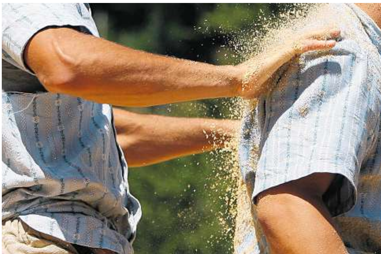
Selbst im Triumph denkt der Sieger an den Verlierer: Auch heute und morgen wird diese typische Szene in Frauenfeld häufig zu sehen sein.

Längst nicht alle werden in den Genuss kommen, die Gänge live zu sehen. Dafür reicht das Fassungsvermögen der Arena nicht aus, in der rund 300 Schwinger um Kränze und Königstitel kämpfen. Dafür warten